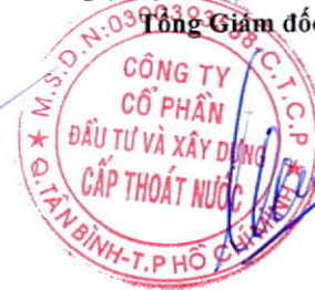
Chu Xuân Lãng