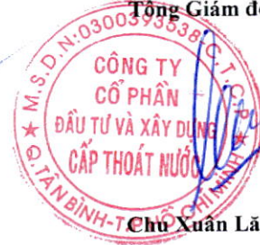
Chu Xuân Lãng